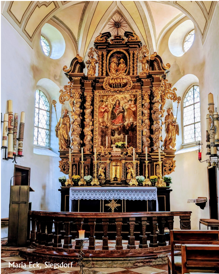
Maria Eck, Siegsdorf